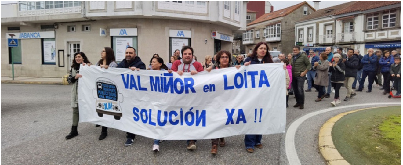
Manifestación da Plataforma Transporte Público Digno Val Miñor